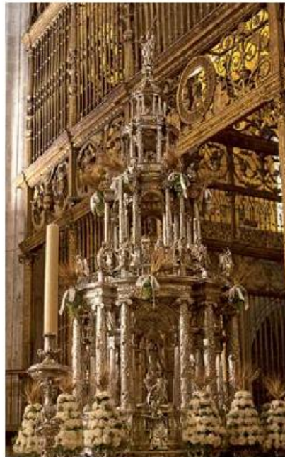
Custodia de Juan de Arfe, catedral de Sevilla.

Los cristianos celebran la fiesta del Corpus Christi a los sesenta días de la resurrección de Jesús. En ella se celebra la Eucaristía.